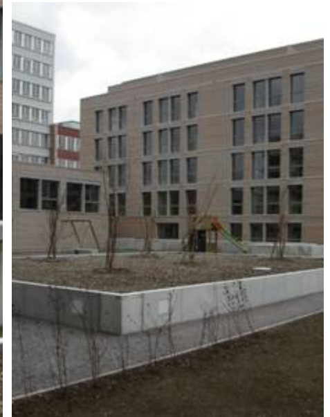
Eulachhof Winterthur, Solarpreis 2007 Minergie P Eco / Nullenergie Wohnüberbauung