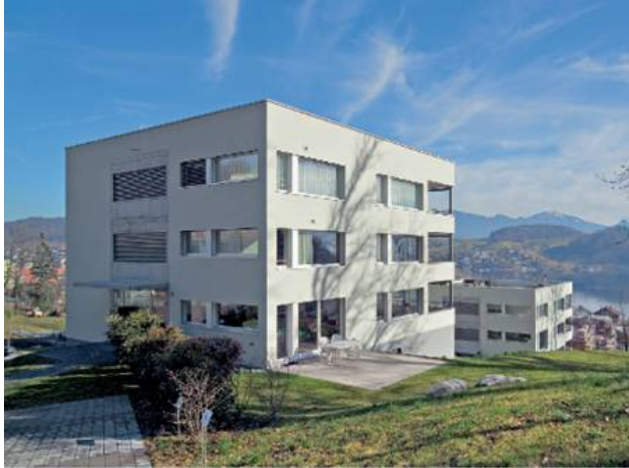
Mehrfamilienhäuser Grosswil, Horw, 2007