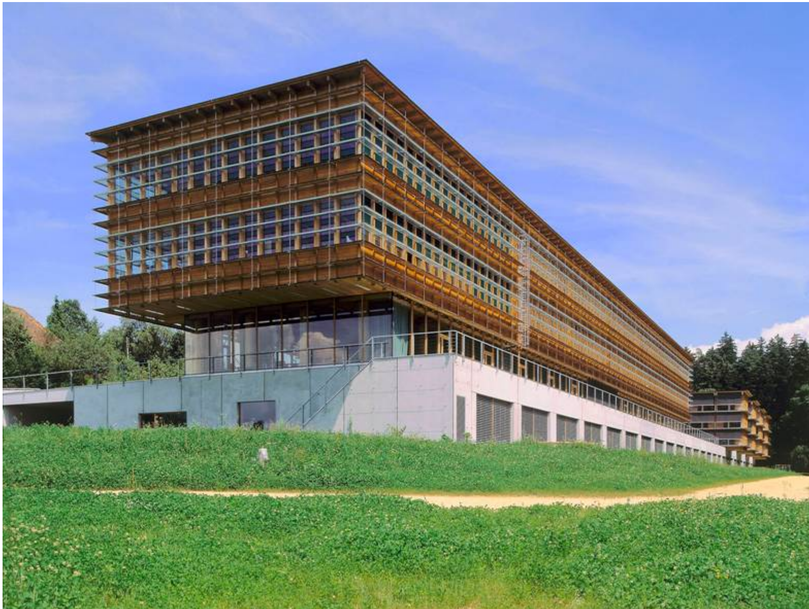
Försterschule Lyss, 1997