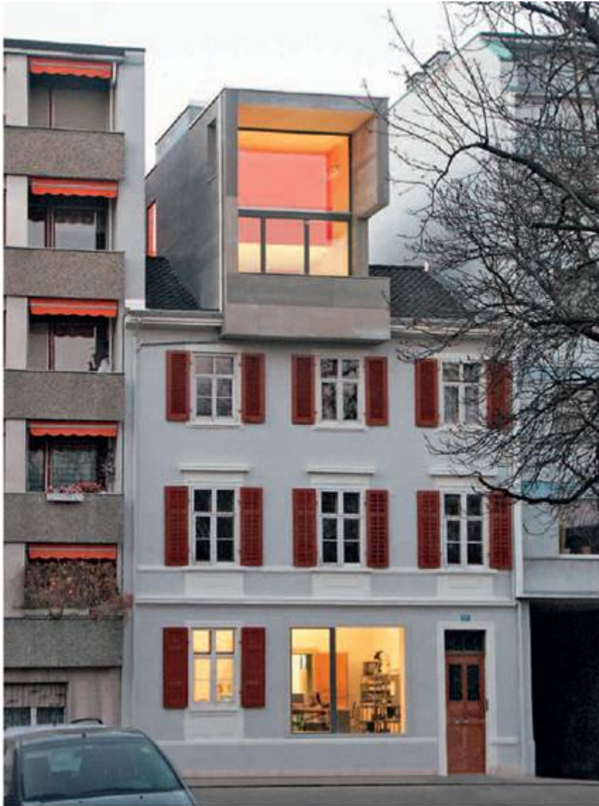
Geringes Gewicht: Basel, 2003