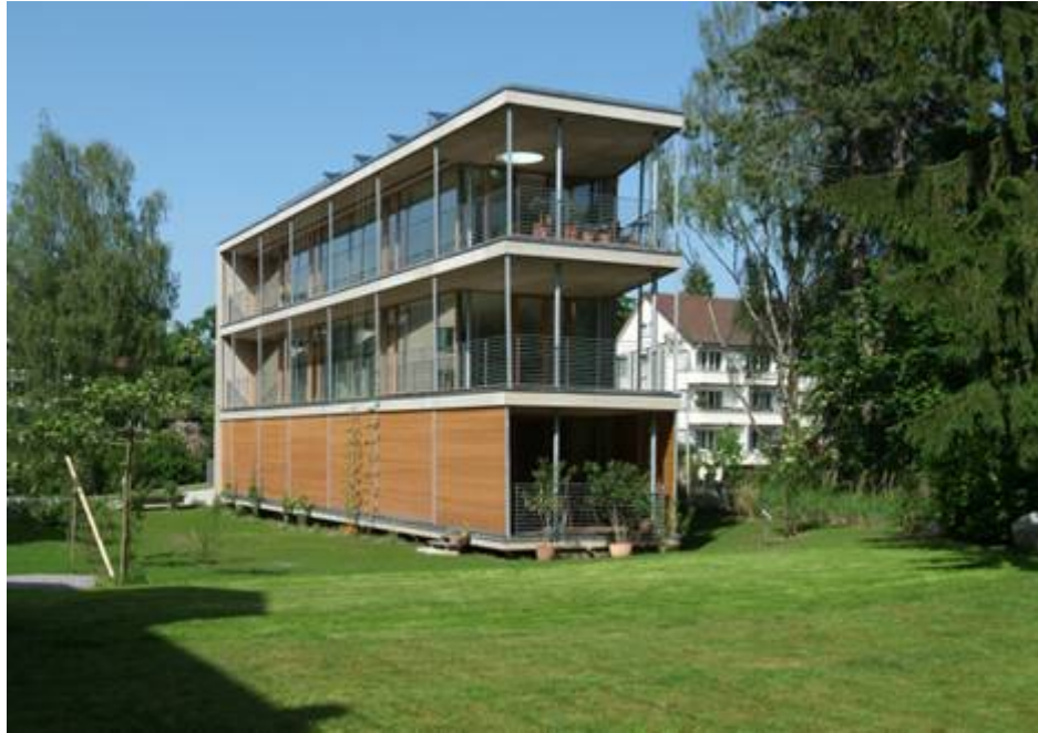
Mehrfamilienhaus, Bern- Liebfeld, 1. Minergie-P-Eco Gebäude, Solarpreis 2007