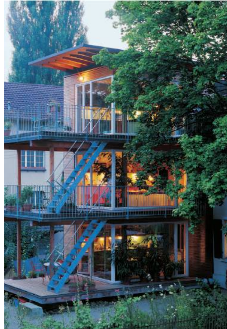
Rasch und trocken: Winterthur, 2004