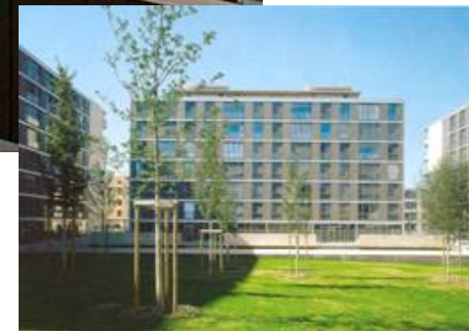
Le Pommier, Geneve, 2004