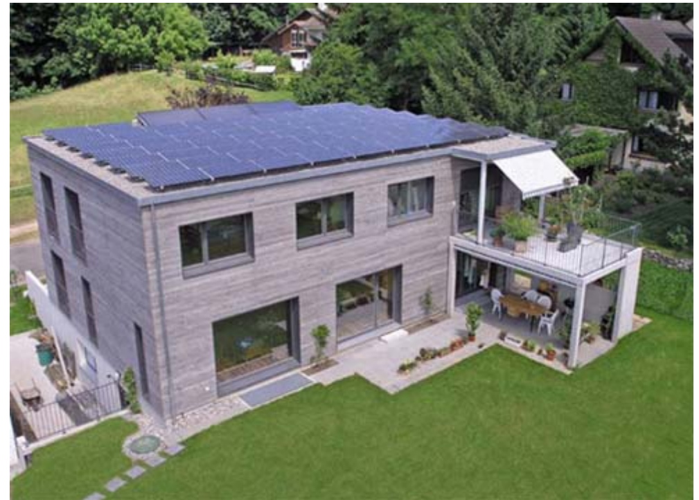
Einfamilienhaus, Riehen Plusenergiehaus (262% Versorgung) Solarpreis 2008