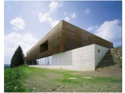
Sporthalle Villaz St. Pierre, 2007