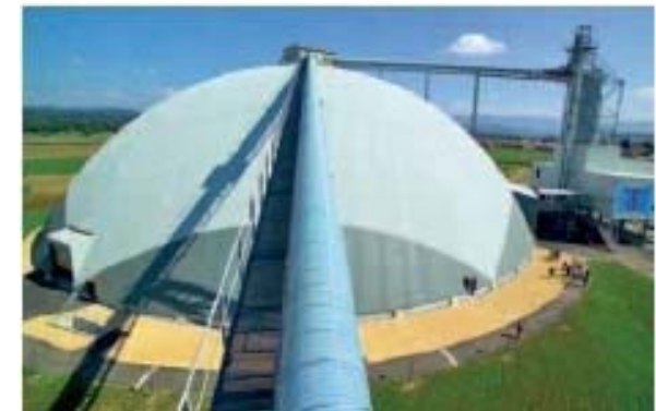
2005 Saldome, Möhlin 93 x 31 m (bindet ca. 400 to CO 2 )