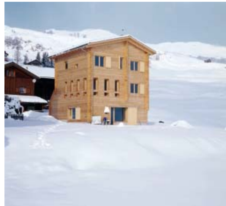
Massivholzbau Degen GR, 2004