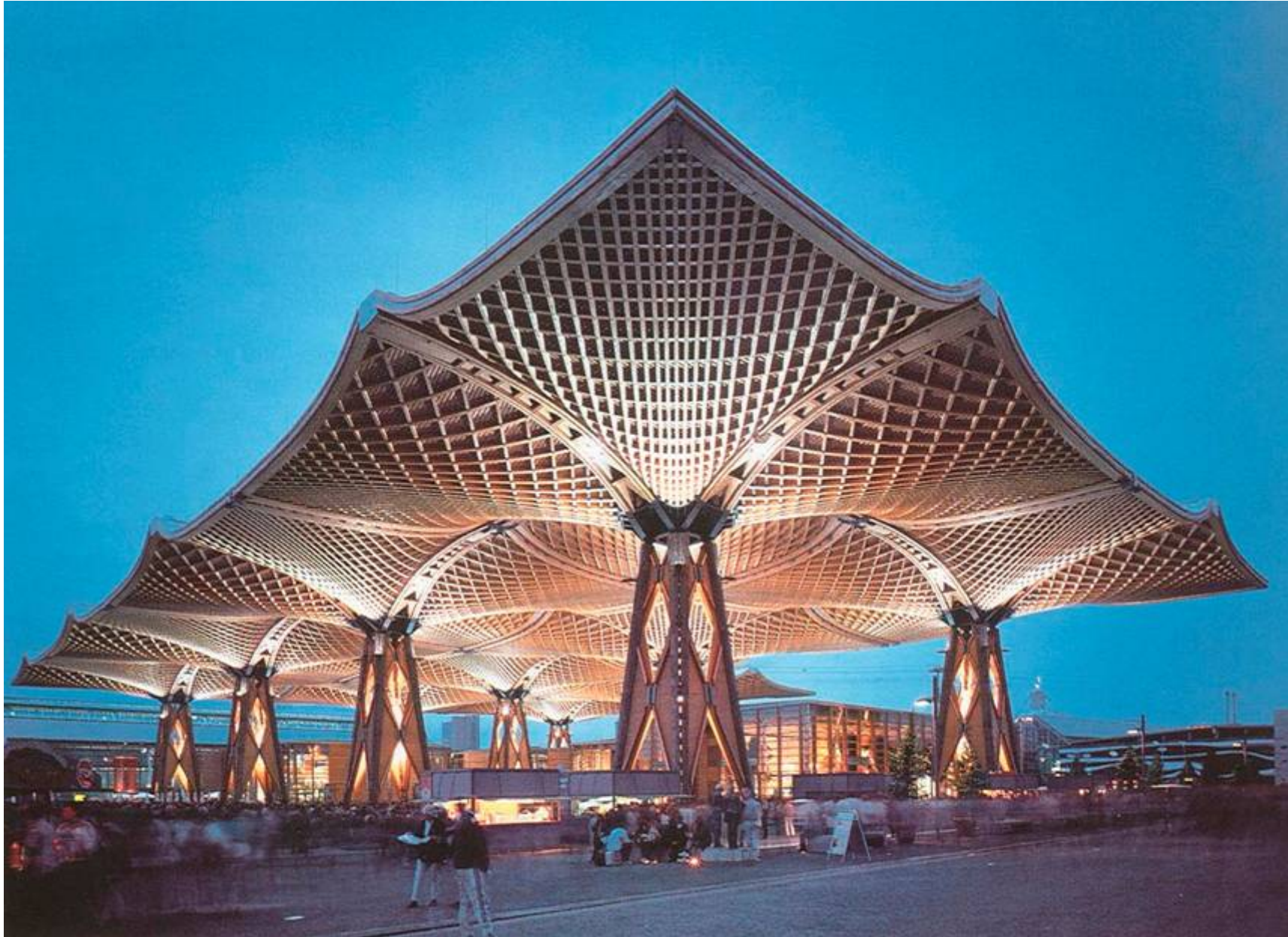
Expo-Dach Hannover, 2000