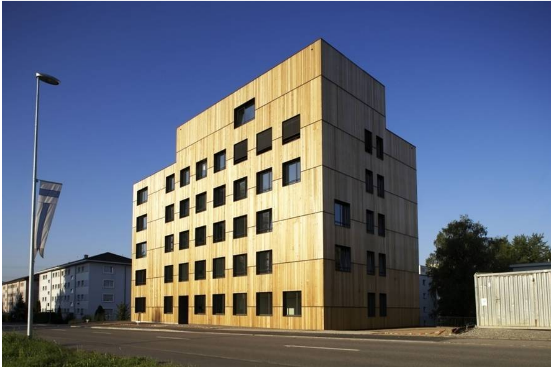
Holzhausen, Steinhausen, 2006