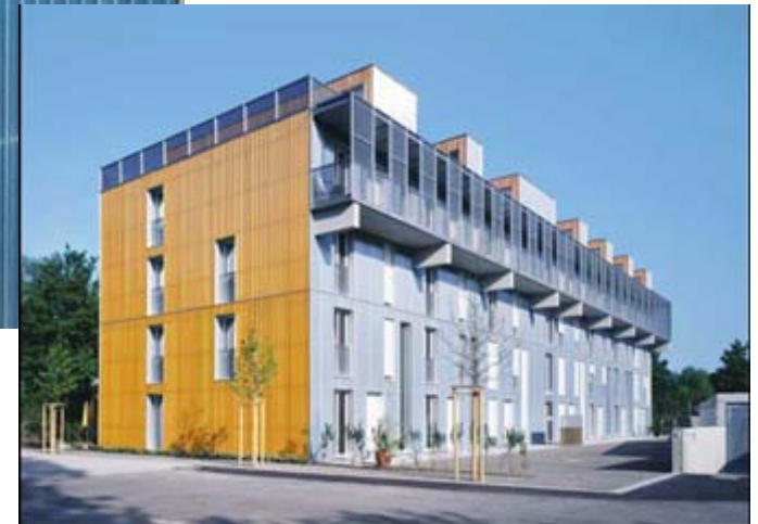
Neumühlestrasse Winterthur, 2004