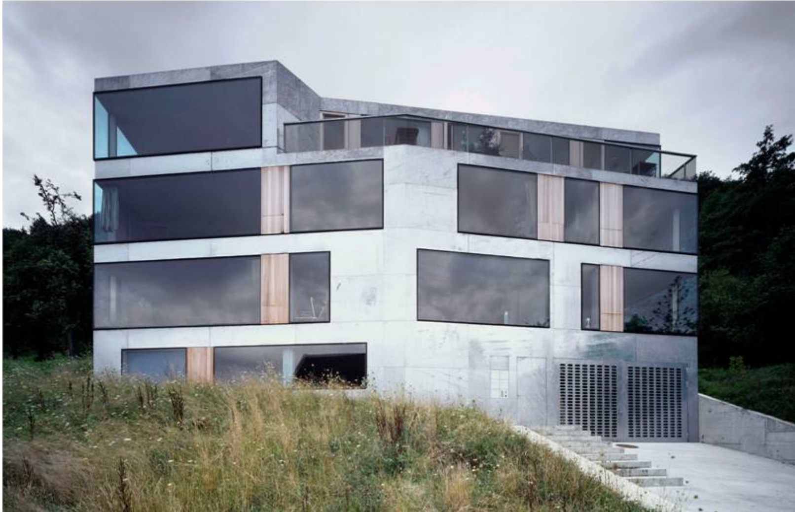
Mehrfamilienhaus Zürich, 2005