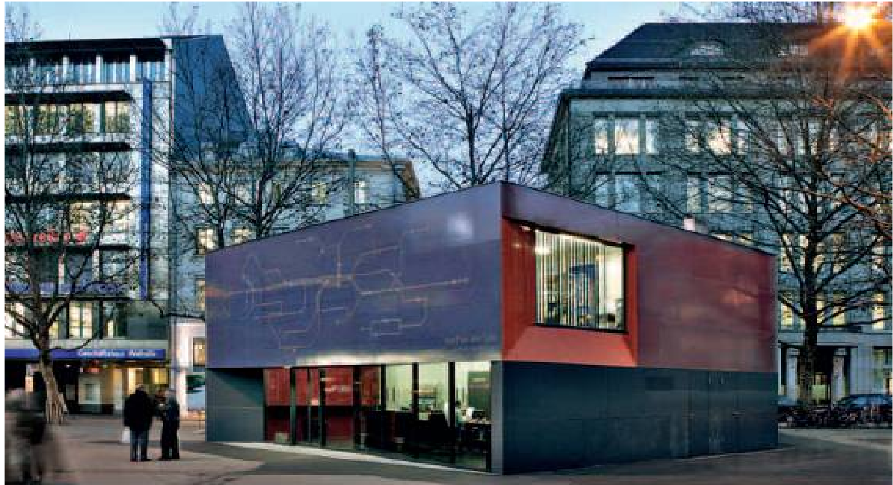
Pavillon Verkehrsbetriebe St. Gallen, 2004