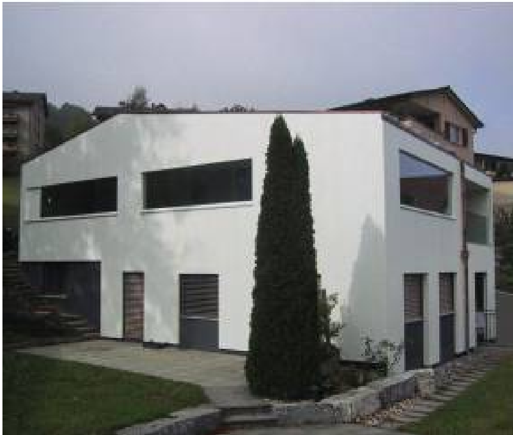
Einfamilienhaus Hergiswil, 2004