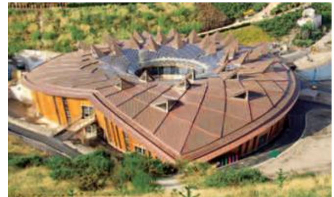
Eden Project, St. Austell (GB) 2005