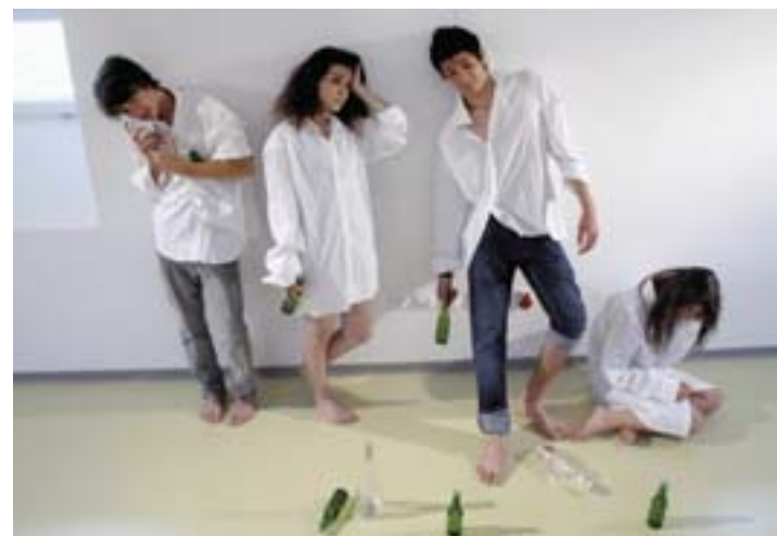
I risultati del lavoro dei ragazzi saranno presentati alla popolazione tramite manifesti affissi in città.