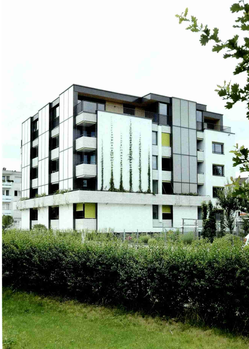
Das Leuchtturmprojekt an der Stettbachstrasse in Zürich-Schwamendingen.