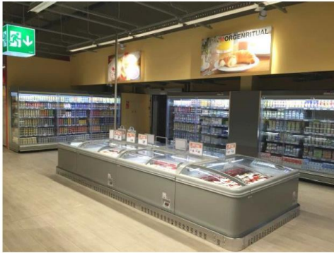
Festinstallierte, steckerfertige Kühlmöbel