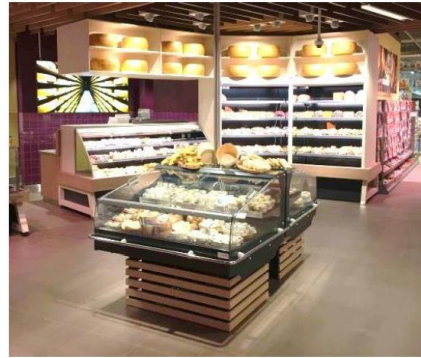
Abbildung 1 Beispiele von steckerfertigen Kühlmöbeln: festinstallierte, steckerfertigen Kühlmöbel (links) werden in der KVZ berücksichtigt; mobile, verschiebbare steckerfertige Kühlmöbel (rechts) hingegen nicht.