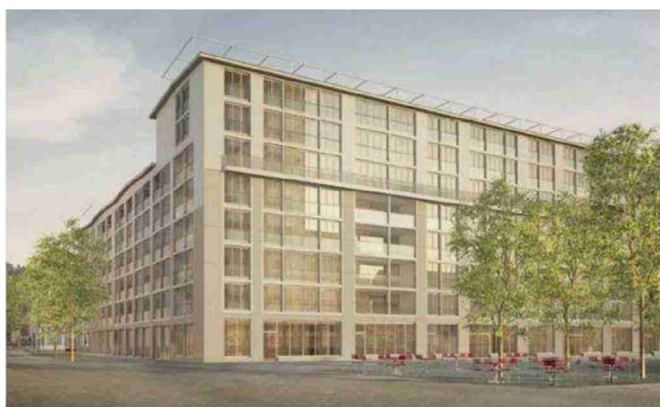
Mitte 2018 beginnt die erste Bauphase des 2000-Watt-Areals Lokstadt Winterthur mit dem Haus «Krokodil», unterstützt durch das ZKB Umweltdarlehen.

Wer beim Renovieren oder Bauen nachhaltige Kriterien berücksichtigt, tut sowohl der Umwelt als auch sich selber Gutes. Das ZKB Umweltdarlehen der Zürcher Kantonalbank fördert ressourcenschonende Projekte in Form von Spezialkonditionen.