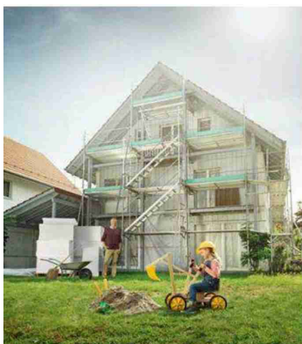
Mit dem ZKB Umweltdarlehen profitieren Bauherren vom Einfamilienhaus bis zur Grossüberbauung von bis zu 0,8 Prozent Zinssatzreduktion auf den Zinssatz der gewählten ZKB Festhypothek.

Foto: ARGE Bauunternehmensgruppe AG, Bildgruppe Architekt.