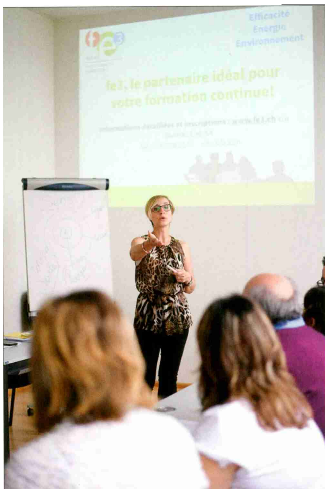
Fondée par le Bureau EHE SA en 2010, la plateforme de formation continue fe3 propose des cours et des formations continues liés à l'efficacité énergétique et environnementale.

La plateforme fe3 propose des nouveaux de cours durant le deuxième semestre 2018 et initie une toute nouvelle formation basée sur les outils de communication pour tiers du bâtiment. TEXTE MARY-LUCE BOAND COLOMBINI / COPYRIGHT BUREAU EHE SA