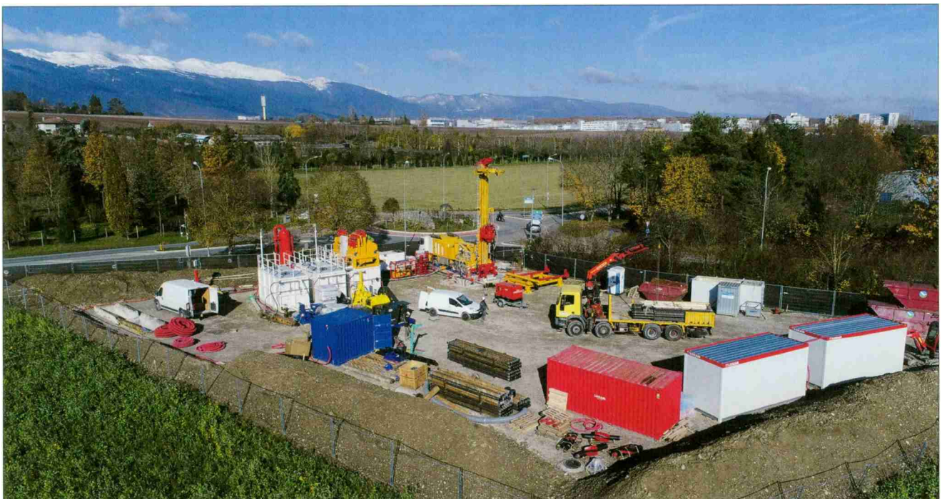
Forages d'exploration pour l'exploitation de la géothermie dans le canton de Genève.

Cinq exemples de l'initiative Exemplarité énergétique de la Confédération illustrent les mesures écologiques mises en œuvre par les acteurs publics dans le contexte de la Stratégie énergétique 2050.