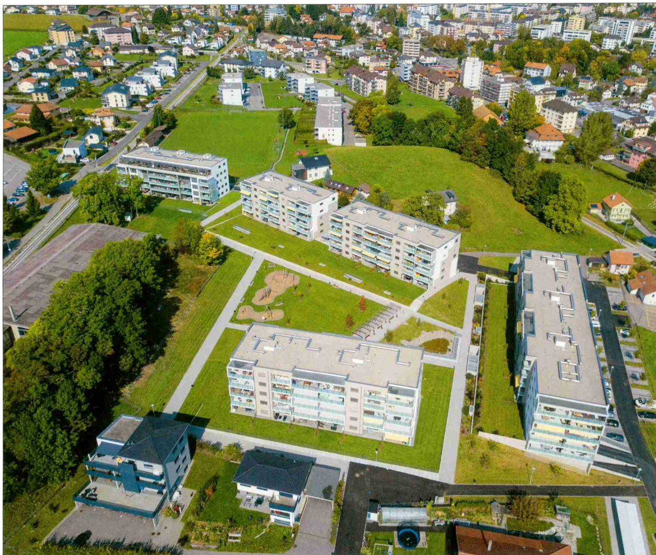
166 logements locatifs MINERGIE de la Suva à La Tour-de-Trême.