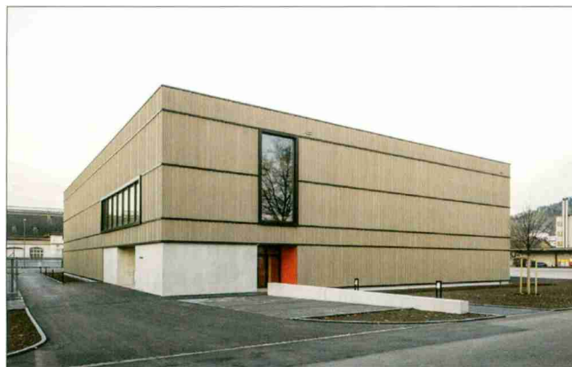
La première salle de sports suisse dotée du label Minergie-A-ECO est utilisée par le DDPS et par les associations sportives de Thoune.

En collaboration avec Projeco SA, la Suva a construit entre