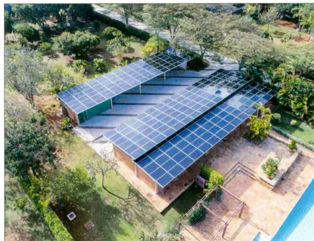
L'ambassade de Suisse est la première au Brésil à être entièrement alimentée en énergie renouvelable.