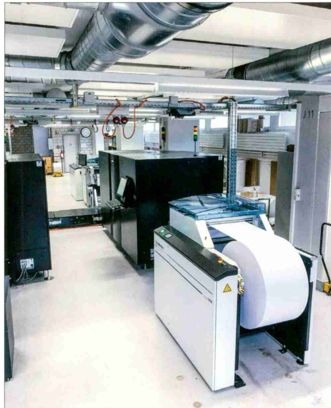
Les deux nouveaux systèmes d'impression à jet d'encre de l'Office fédéral des constructions et de la logistique consomment moins de la moitié d'énergie par rapport aux trois anciens systèmes d'impression laser en place.