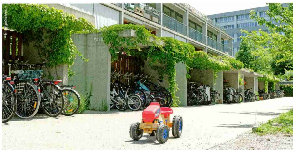
Die Siedlung ist (fast) autofrei.