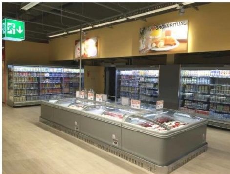
Festinstallierte, steckerfertige Kühlmöbel