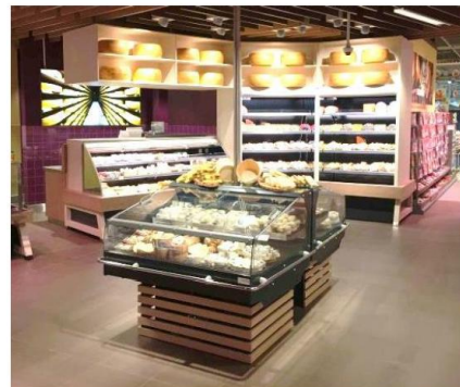
Illustration 1 Exemple de meubles frigorifiques prêts à être branchés : les meubles frigorifiques installés, prêts à être branchés (à gauche) sont pris en compte dans l'IFC ; tandis que les meubles frigorifiques coulissants mobiles (à droite) ne le sont pas.