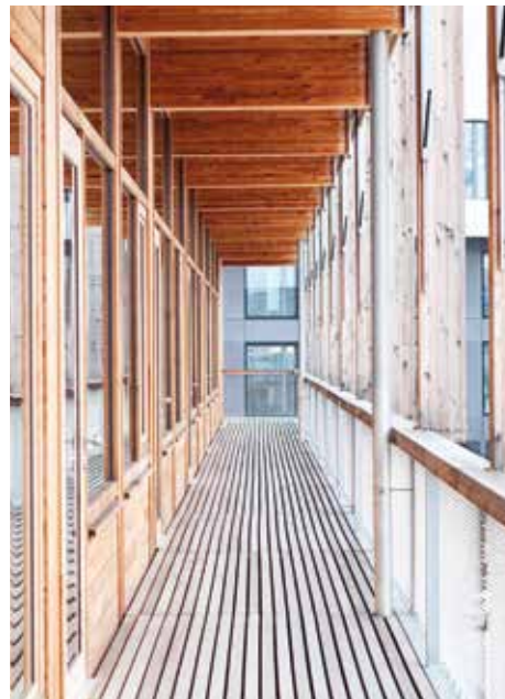
Edificio scolastico Pfungstweid, Zurigo. ZH-267-ECO