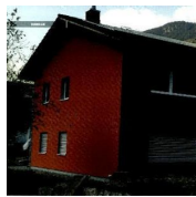
Aria nuova per la vecchia casa di famiglia